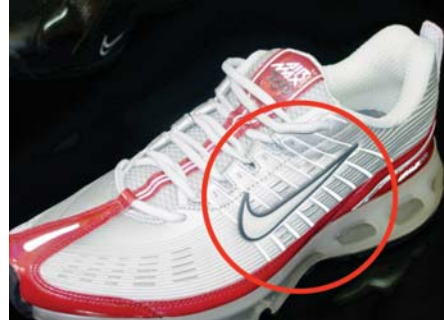
Zaštićeni žig na originalnoj tenisici

Na slikovnom prikazu rezultata provedene usporedbe obilježja spornog znaka i zaštićenog žiga utvrđene sličnosti prikazane su u gornjem krugu, a razlike u donjem okviru.