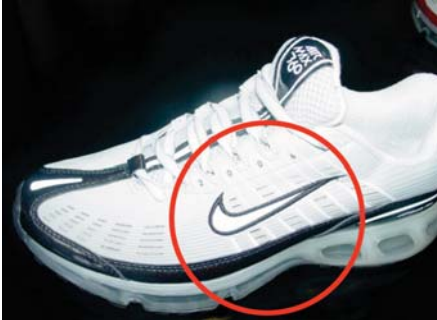
Sporni znak na spornoj tenisici